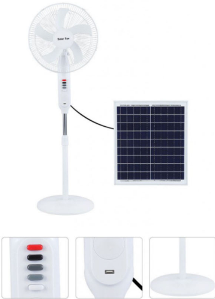
quạt năng lượng mặt trời sf128