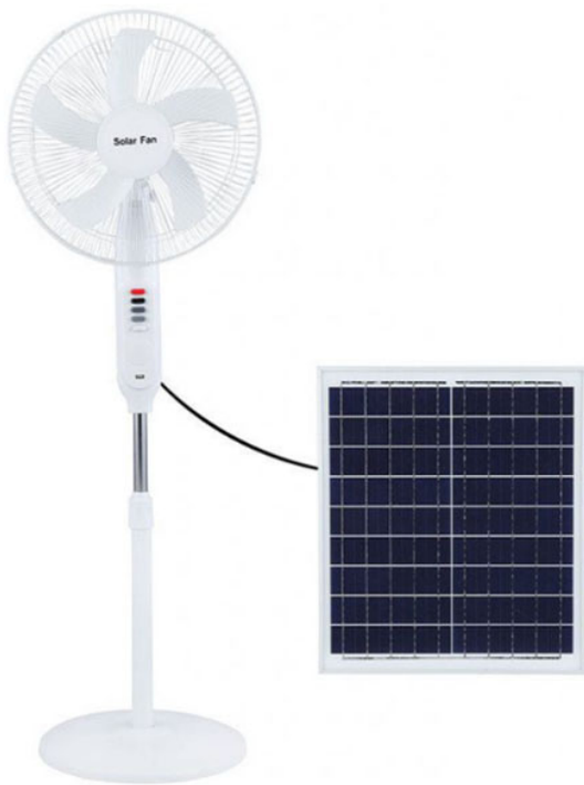
quat cay cao cap nang luong mat trời sf128